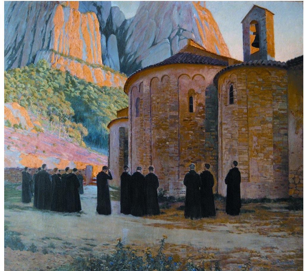
Santiago Rusiñol. Àngelus a Santa Cecília de Montserrat , 1896-97. Museu Cau Ferrat, Sitges.

Director del Museu de Montserrat i especialista en Santiago Rusiñol.